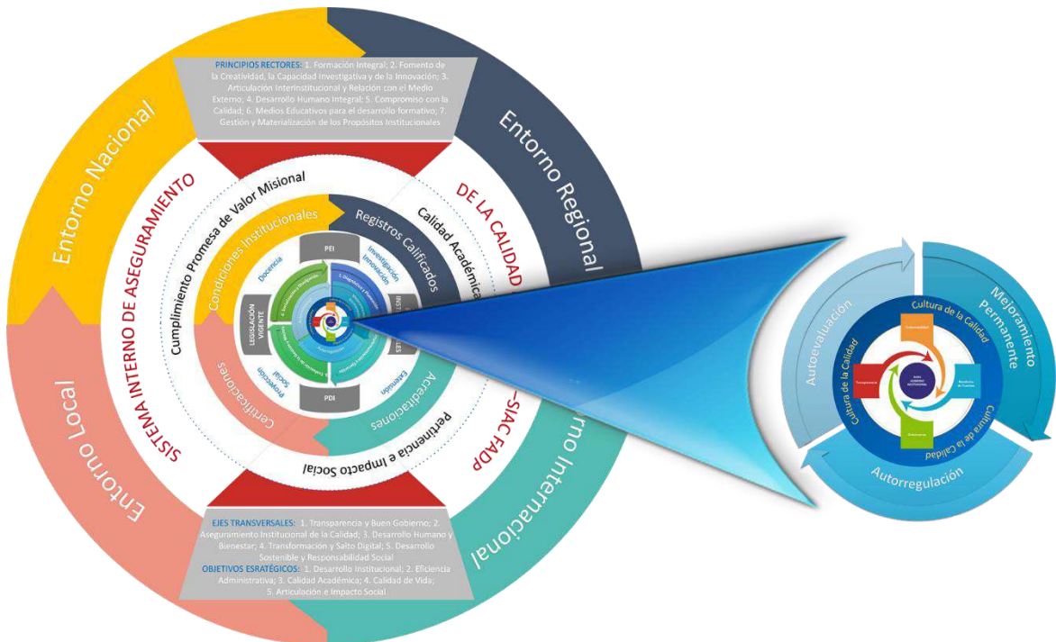
Gráfica 1. El Buen Gobierno como Núcleo del Sistema Interno de Aseguramiento de la Calidad

En la Fundación Academia de Dibujo Profesional, el Buen Gobierno Institucional se constituye en el núcleo del Sistema de Interno de Aseguramiento de la Calidad -SIAC FADP, por el cual se garantiza la Calidad Académica y la Pertinencia e Impacto Social de la oferta educativa en cumplimiento de la Promesa de Valor Misional, expresados en la aprobación de Condiciones Institucionales y en la obtención de Registros Calificados, Acreditaciones en Alta Calidad y otras certificaciones y licencias para el desarrollo responsable de los propósitos institucionales.