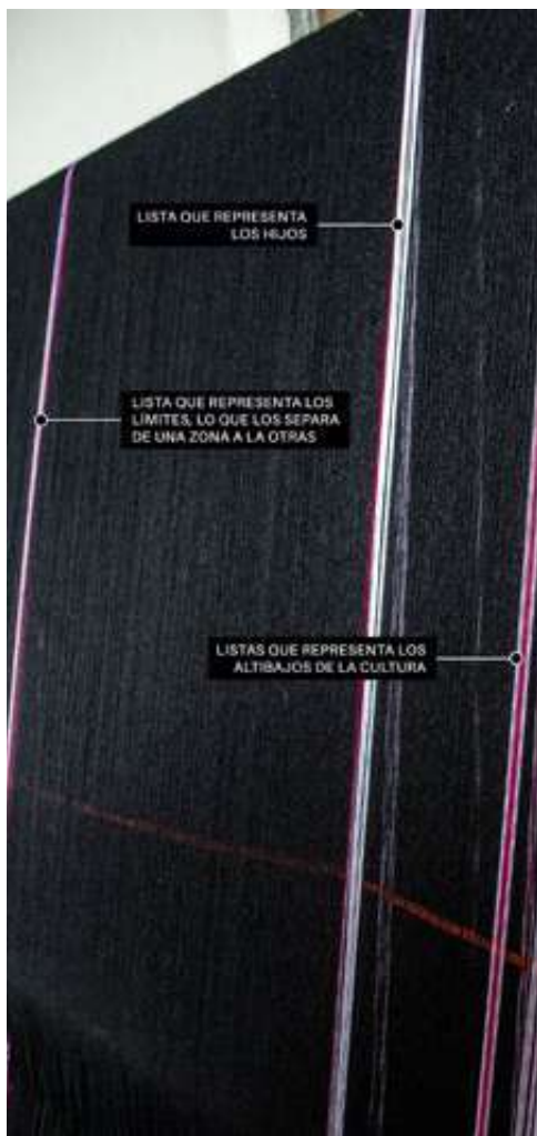
Figura 16. Listado, Cauca. [Fotografía Por Michelle Bastidas]. (Vereda Peña de corazón, Silvia-Cauca. 2017).

El Anaco es de color negro y representa la Madre Naturaleza, este posee un diseño redondo, su material es de lana-hilo Merino, el anaco cuenta con diferentes “listas” (Fig. 16). Las listas son líneas tejidas de diferentes colores todo depende de la persona que lo use, es decir cada anaco es especial, Tombe (2017) afirma: anteriormente existían más listas por- que hacían referencia a las zonas del resguardo (Guambía 9 zonas y 33 veredas) cada zona se definía por diferentes colores en las listas; pero las listas no solo representan la zona, también representa el número de hijos.