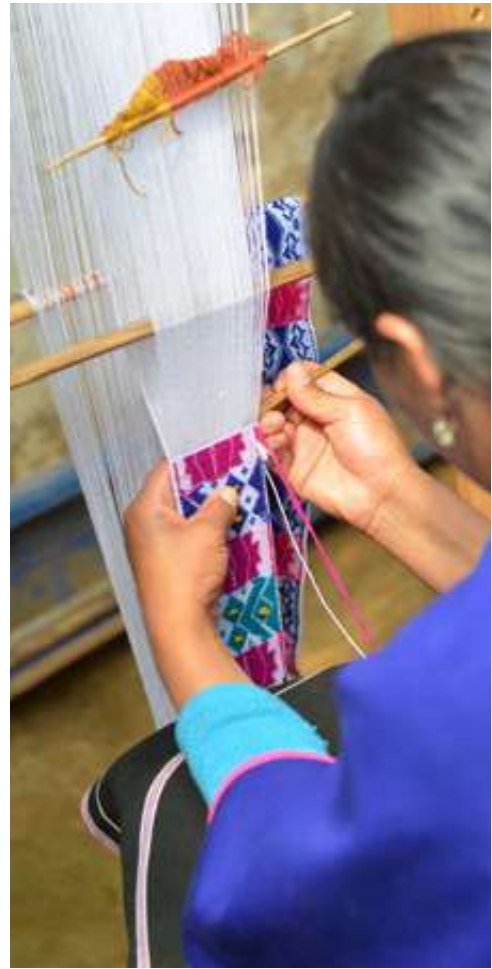
Figura 15. Chumbe, Cauca. (Vereda Tranal, Silvia-Cauca. 2017).

“Cuando los Piurek comenzaron a crecer, Pishimisak les enseñó a fabricar el vestido propio de acuerdo a los colores y significados de keshimpoté 9 o arco iris... Color verde significa los valles y montañas de nuestro pueblo; el color azul las lagunas de nuestros páramos; el anaranjado las riquezas de nuestros subsuelos, las siembras y cosechas de nuestros cultivos tradicionales; el morado yale 10 pillik significa, la noche que cae siglo tras siglo, pero a su vez significa los amaneceres que vemos día tras día, año tras año; el rojo Ke pikig es el color del Shau, o derrumbe cuando vinieron los primeros Wapia de las dos lagunas, significa además la menstruación de nuestras mujeres cuando están con el periodo. (Dagua, et. 2002 - 2005)