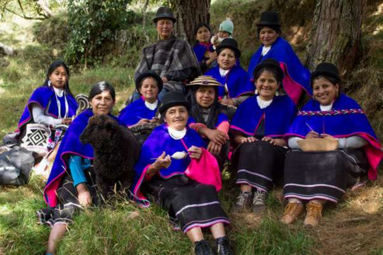
Figura 2. Grupo de Artesanas – Arte Misak, Cauca. (Vereda Peña de Corazón, Silvia-Cauca. 2017).