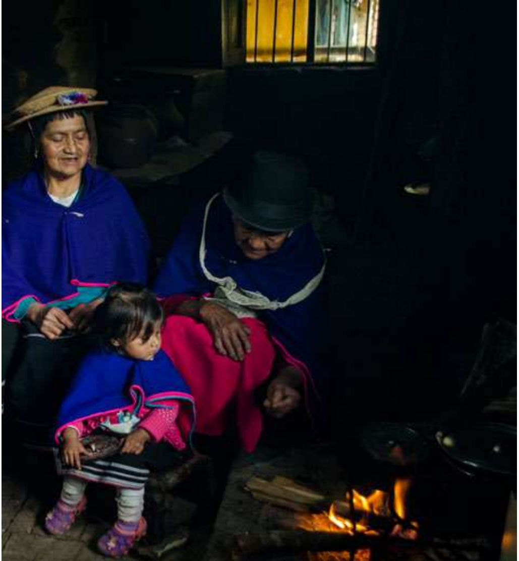
Figura 1. Generaciones alrededor del Fogón, Cauca. [Fotografía Por Michelle Bastidas]. (Vereda Ñimbe, Silvia-Cauca. 2018).

observar la importancia y la necesidad de plasmar o documentar la cosmovisión del color del vestuario, ya que es muy importante tener registros físicos para que esta información invaluable no se pierda con el paso del tiempo. De manera que, ¿los registros escritos tangibles en forma de escrito e imágenes (fotografía) pueden apoyar en la preservación del conocimiento local sobre color en la cultura Misak?