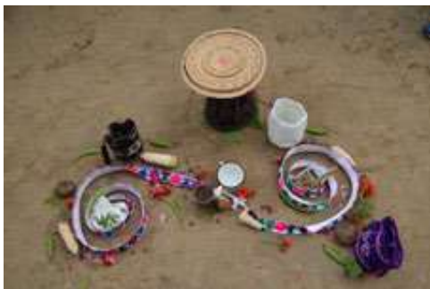
Figura 7. Ritual de Purificación, Cauca. [Fotografía de Michelle Bastidas]. (Vereda Peña de corazón, Silvia-Cauca. 2017).

También encontramos que para la cultura todo su alrededor, transmite sus creencias y costumbres, lo cual permite mantener una convivencia armónica con la naturaleza; la cultura Misak se caracteriza por el amor y el respeto que sostiene con el medio ambiente, por esta razón, sus costumbres, creencias y características reflejan la belleza de la madre naturaleza (Fig. 7), por consiguiente, el color juega un papel primordial en esta cultura, ya que según la cosmovisión cada color que lucen tiene su respectivo significado el cual hace parte y representa el ser Misak.