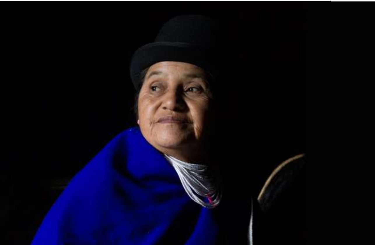
Figura 13. Reboso Azul, Cauca. (Silvia-Cauca. 2017).

Por otra parte, las Mujeres Misak utilizan el Reboso (ver fotografía 10) también elaborado con el mismo material y tiene el mismo significado del color del Anaco de los hombres Misak, además la mujer Misak no solo utiliza el Reboso azul si no también debajo de este utiliza el reboso rojo (Fig. 13).