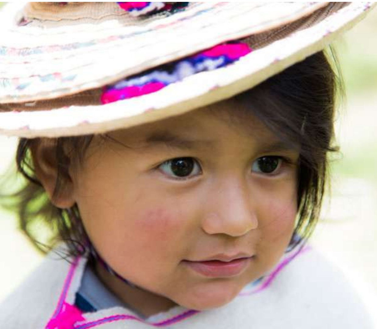
Figura 11. Indumentaria especial, Cauca. [Fotografía Por Jenniffer Beltran]. (Vereda Peña de Corazón, Silvia-Cauca. 2018).