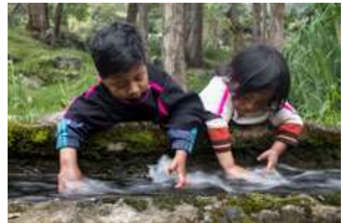
Figura 10. Niños del agua, Cauca. (Vereda Ñimbe, Silvia-Cauca. 2018).