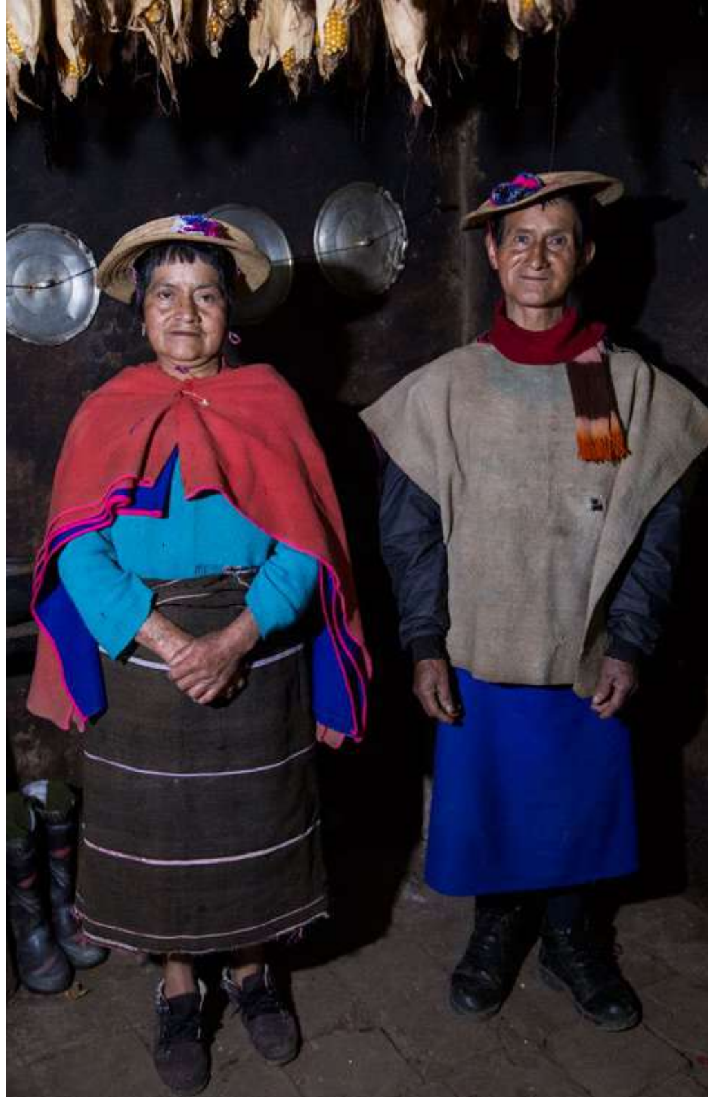
Figura 5. Indumentaria tradicional, Cauca. (Vereda Ñimbe, Silvia-Cauca. 2018).