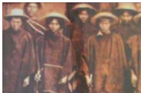
Figura 3. La enteriza Namui Kollimisak Merai Wai. (2002-2005) “La voz de nuestros mayores” Cabildo Indígena de Guambia. Proyecto de recuperación de memorias ancestrales del pueblo Guambiano. Santiago Territorio Guambiano.

“1) El uso de la faldilla azul entre los hombres representa un cambio efectivo hacia una prenda que, según relatan algunos, era usada antes de la conquista; 2) El tipo de sombrero adoptado, de contornos redondeados y apariencia cónica, se diferencia notablemente de los demás tipos de sombreros indígenas encontrados en Sudamérica. 3) Durante este mismo período los Guámbianos estaban bajo fuertes presiones de la gente blanca de la localidad para dividir su resguardo y adoptar maneras occidentales de vestirse, pero los Guámbianos supieron defender con tenacidad sus tierras y el derecho a vestirse a su manera. Para ellos su indumentaria era un símbolo importante de su identificación indígena, la cual deseaban mantener a toda costa, y 4) La vestimenta Guambiana examinada en conjunto revela una verdadera combinación de elementos con sello propio que los distingue claramente de otros grupos indígenas del continente” (p. 316).