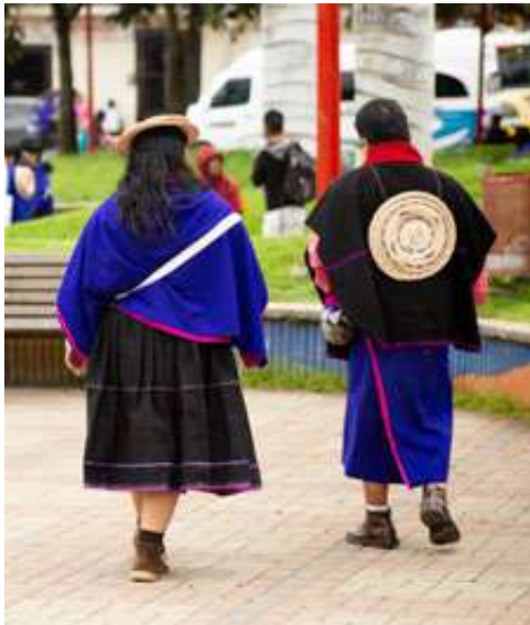
Figura 9. Indumentaria Femenina y Masculina tradicional, Cauca. (Silvia-Cauca. 2018).

Dentro de la indumentaria Misak está la Ruana (Fig. 9) la cual es utilizada por los hombres Misak, elaborada por las mujeres, sus esposas, como regalo de compromiso a su matrimonio como lo indican el grupo de artesanas, para su elaboración se utiliza el telar el cual es una especie de armazón construido en madera en la que se colocan los hilos en la parte de arriba y debajo, el material con la que realizan esta prenda se llama hilo-lana Merino o anteriormente, lana de Oveja; al igual que el Reboso en las mujeres, estas prendas anteriormente manejaban un solo color: el negro. Para hombres y mujeres Misak hoy en día por cambios de la modernización al pueblo Misak ha incrementado nuevos tonos en las Ruanas en gama de grises, el Blanco que se utiliza en ocasiones sumamente especiales y la más tradicional el negro (Tombe, 2017).