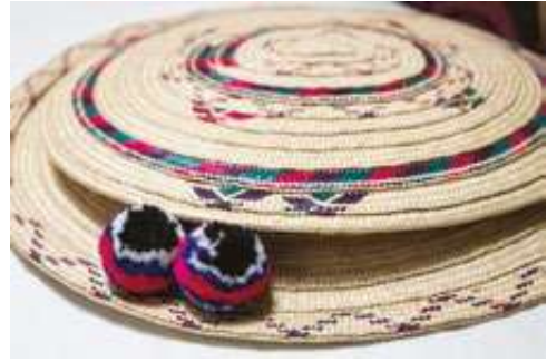
Figura 8. Sombrero típico Misak, Cauca. (Silvia-Cauca. 2018).

El sombrero típico Misak, Tampal kuari (Fig. 8) visto desde la parte superior, es circular, elaborado en hoja de tetera y trenzado a mano por la misma comunidad Misak, también en el sombrero típico se puede observar la simbología la cual es tinturada con anilina de colores del aroiris 8 siendo los más representativos magenta (rojo), violeta y verde.