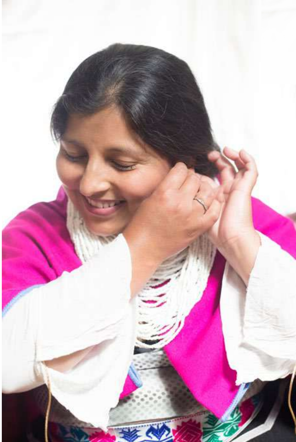
Figura 14. Rebozo Rojo, Cauca. [Fotografía Por Alex Ballesteros]. (Silvia-Cauca. 2018).