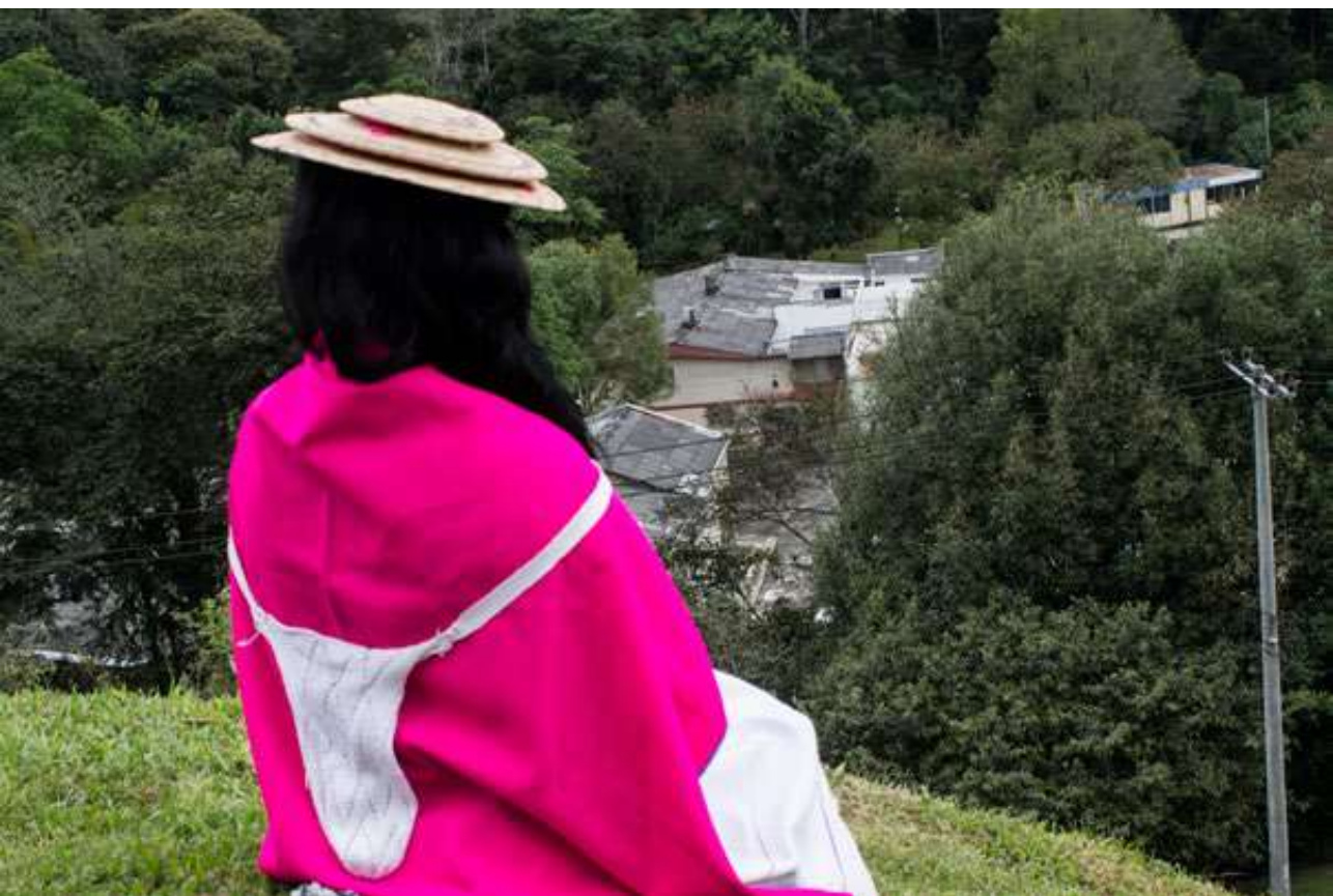
Figura 18. Jigra, Silvia, Cauca. [Fotografía Por Jenniffer Beltrán]. (Popayán-Cauca. 2018).

aprendidas en el Nak Chak para cuando llegue la etapa donde se va a casar ella entregue la mochila a su esposo y una Jigra a la madrina como un obsequio. Los símbolos que aparecen en las diferentes mochilas hacen representación a varios elementos importantes de la cultura como el fogón, por medio de un rombo en el centro y a los lados unos triángulos que representan las tulpas, también representan los páramos, el arcoíris, las lagunas y montañas.