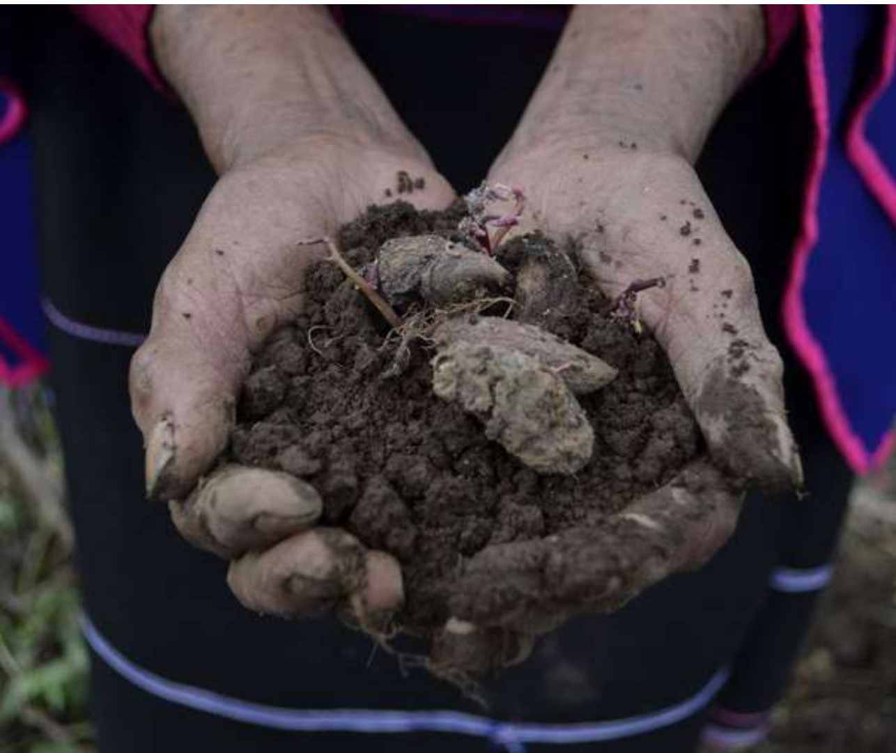
Figura 12. Cultivos, Cauca. [Fotografía Por Michelle Bastidas]. (Vereda Nímbe, Silvia-Cauca. 2018).