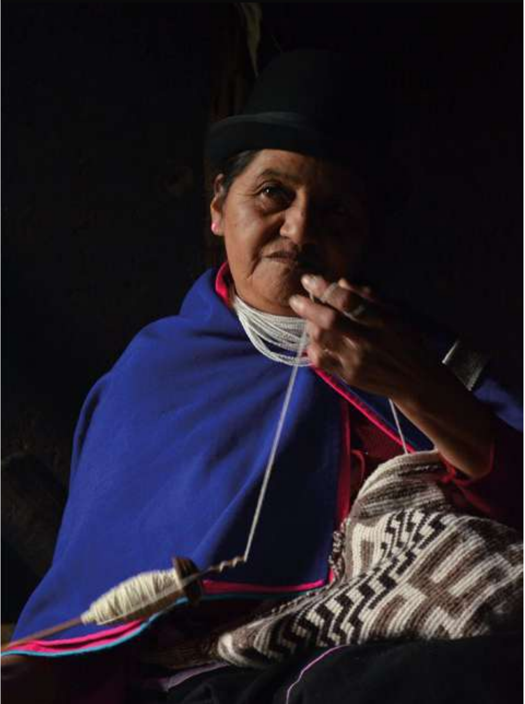
Figura 17. Mochila, Cauca. [Fotografía.14. Por Michelle Bastidas]. (Silvia-Cauca. 2017).