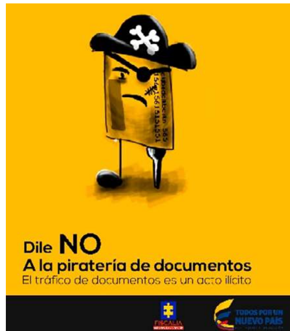
Figura 3. Afiche y spot realizado por Fabián Galvis Módulo: proceso creativo

En el siguiente ejemplo ( figura 4 ), el problema abordado es el maltrato que los usuarios del sistema de transporte Masivo Integrado de Occidente MIO, les dan a las sillas de los buses articulados. En el proceso se partió del discurso del objeto, llegando a la creación de un personaje (la silla), el cual llamaron Mía. Es ella la encargada de transmitir el mensaje del buen trato por medio de una caña radial y un afiche.